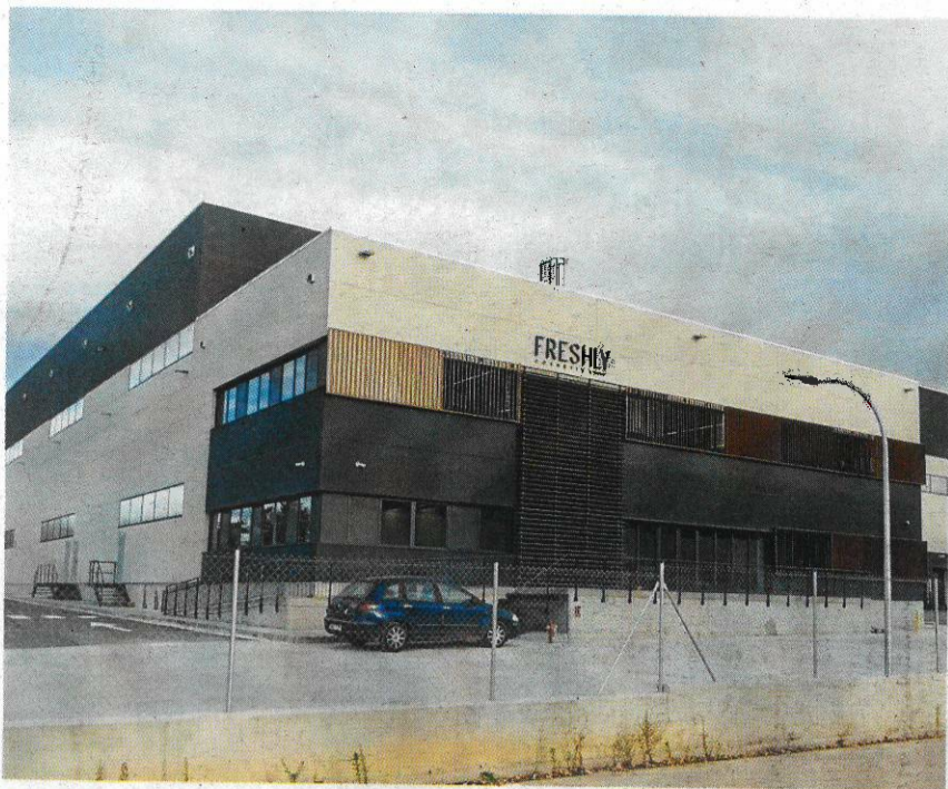
Gandesa Freshly Cosmetics La empresa Freshly Cosmetics puso en marcha por el Black Friday su nuevo centro logístico de Gandesa. Con una inversión de 5 millones de euros, ocupa 14.000 metros cuadrados del polígono La Plana de la capital de Terra Alta. El nuevo centro generará un centenar de empleos.