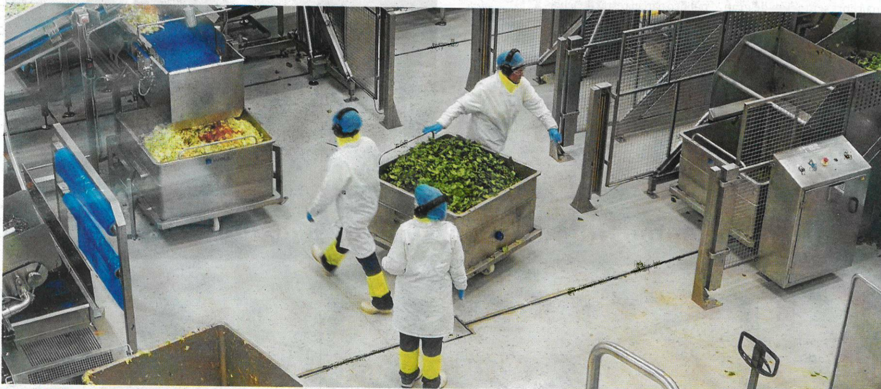
Tortosa/L'Aldea Florette El centro de producción de Florette en las Terres de l'Ebre, situado en el polígono industrial Catalunya Sud entre Tortosa y L'Aldea, duplicó este año el volumen de producción hasta las 6.000 toneladas de vegetales al año. Esto se traduce en 24 millones de unidades de ensaladas y otras verduras envasadas. La fábrica incrementó la plantilla hasta los 130 trabajadores solo un año y medio después de entrar en funcionamiento.

Las noticias de la instalación o ampliación de empresas y de la realización de inversiones se multiplicaron este año. Destacan especialmente las que han elegido el sur de la demarcación: Jabil (l'Aldea), Florette y Kronospan (Tortosa), Amiblu (Camarles), Grup Balfegó y Acuidelta (L'Ametlla de Mar), Freshly Cosmetics (Gandesa)... Sin olvidar otras localizaciones: Montblanc (Bon Preu), Mont-roig (Fischer), Constantí (Lidl) y TGN (Obramat).